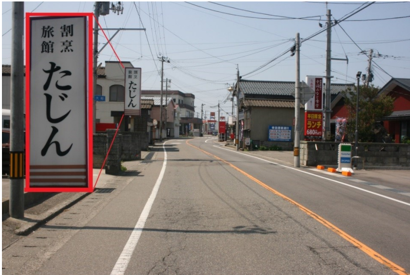
画1: 降1 (「たじん」看板が目印)