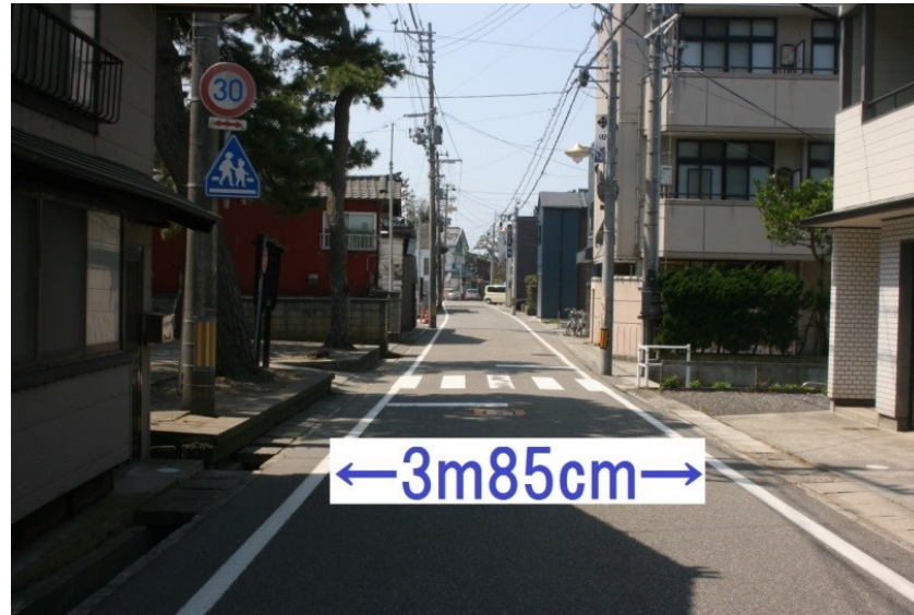
画2: 降2 (横断歩道が目印)